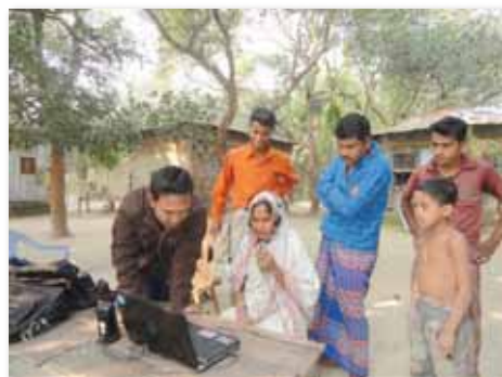
Skypeによる農事相談会@カパシア