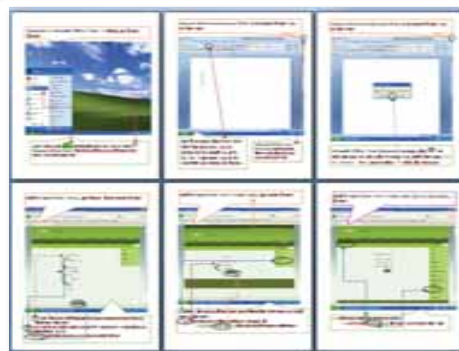
ICTトレーニング教材(コンピュータの使い方)