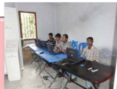
コンピュータ理解度実践テスト