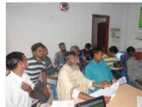
ICTトレーニング@エクラスプール