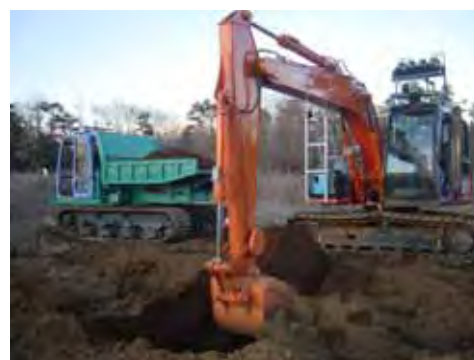
図-2 IT施工システムのプロトタイプ