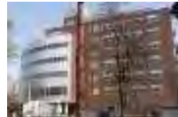
有機材料システム フロンティアセンター