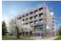
有機エレクトロニクス 研究センター