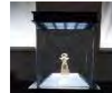
平成28年3月23日(水) ~4月17日(日) 東京国立博物館展示

有機EL照明製品事業化 東京に有機EL照明 導入事例 情報発信拠点オープン 累積150件以上 リビングデザインセンター OZONE 6F