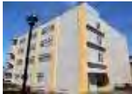
グリーンマテリアル 成形加工研究センター