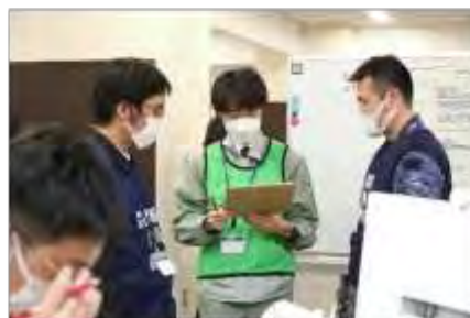
富城県現地災害対策本部と実動対応班の調整