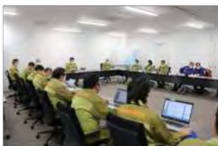
女川町災害対策本部会議