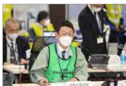
原子力災害合同対策協議会への参加