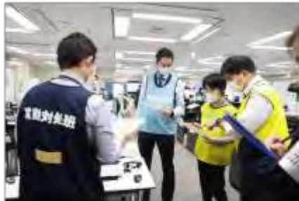
総括班、運営支援班と実動対応班の調整