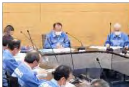
石巻市災害対策本部会議