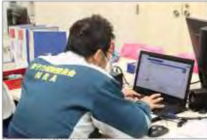
上席放射線防災専門官によるEMC立上げ