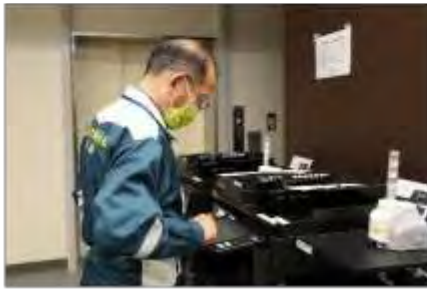
FAXを使用した情報共有