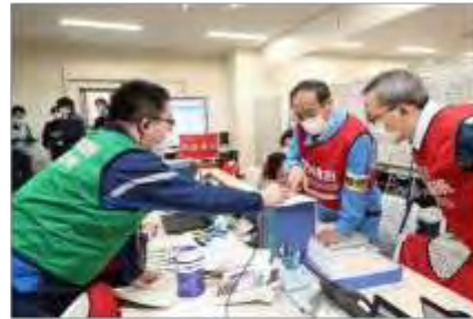
住民安全班と放射線班の調整