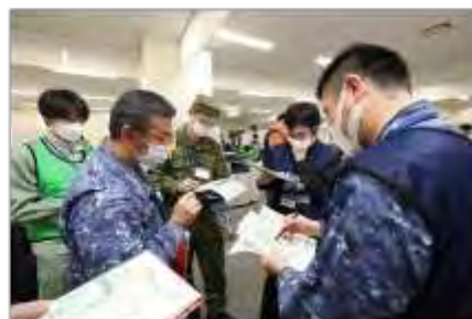
宮城県現地災害対策本部、実動対応班、自衛隊の調整