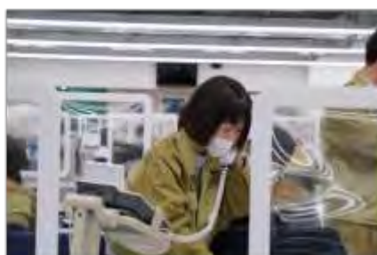
電話による情報収集活動