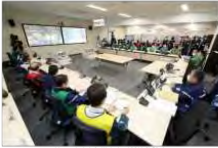
第2回原子力災害合同対策協議会