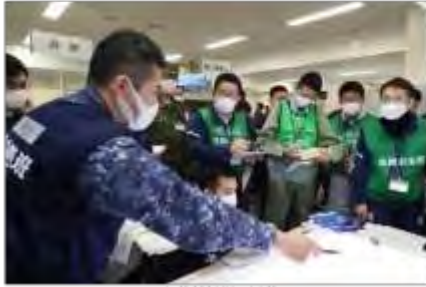
実動対応班の活動