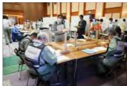
宮城県災害対策本部の活動