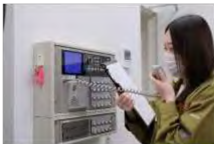
防災行政無線による住民広報