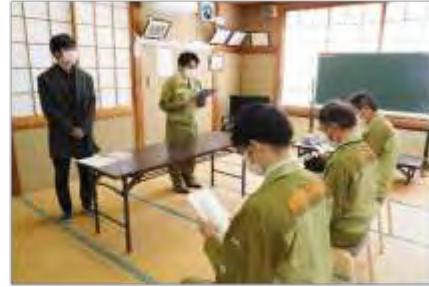
安定ヨウ素剤について説明