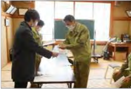
安定ヨウ素剤の配布