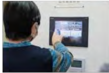
フィルタリングシステム