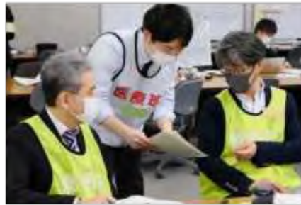
総務班と医療班の調整