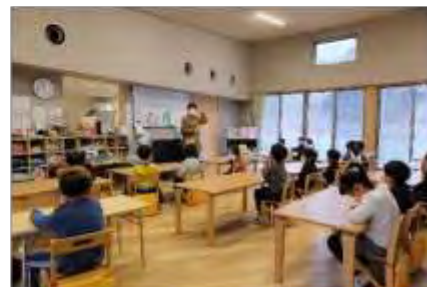
屋内退避状況の説明