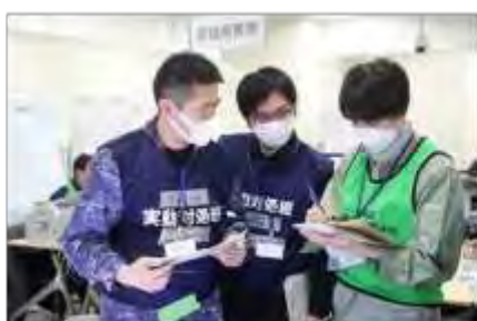
実動対応班との調整