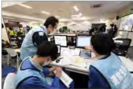
運営支援班の活動