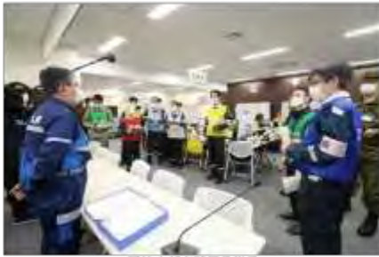
現地本館事務局長指示