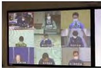
テレビ会議システムを使用した情報共有・調整