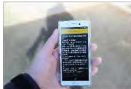
緊急連絡メールによる住民広報