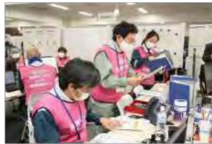
モニタリング情報の確認