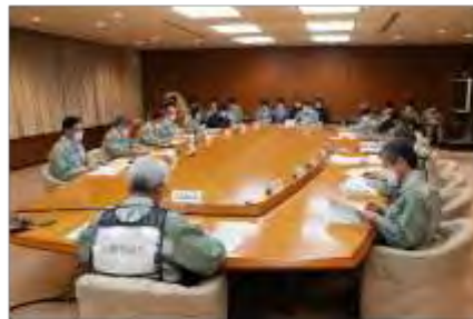
宮城県災害対策本部会議