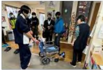
車いすの準備(要配慮者の移動用)