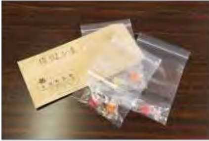
安定ヨウ素剤（模範）