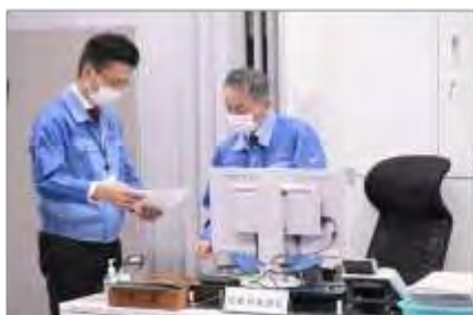
危機対策課長への報告