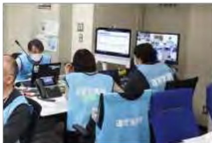
運営支援班の活動