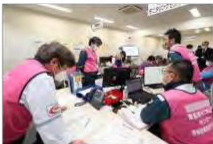
モニタリング計画の立案