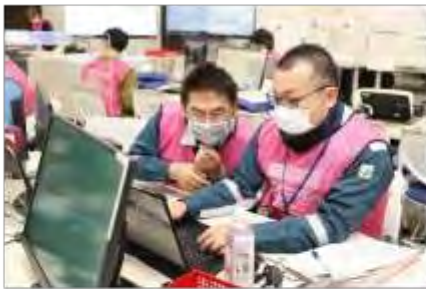
緊急時モニタリングデータの確認