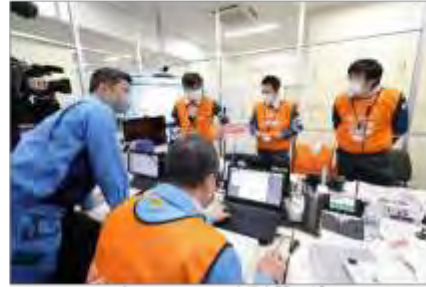
プラントチームと事業者間の確認