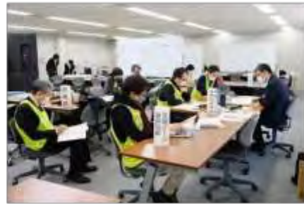
支援チーム事務局長補佐と総務班の調整