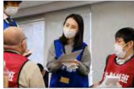
放射線班と広域・国際班の調整