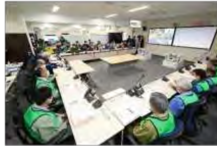
第1回原子力災害合同対策協議会