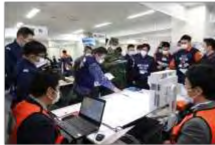
D-NEETを用いた情報共有・調整