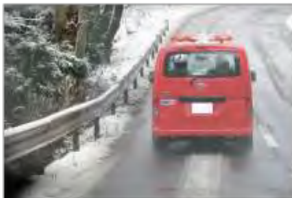
広報車による住民広報