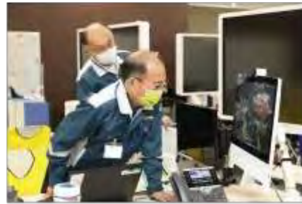
テレビ電話を使用した情報共有