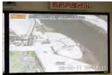
自衛隊によるヘリコプター映像伝送