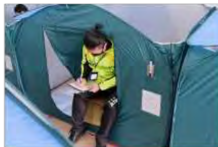
テント及び簡易ベッド