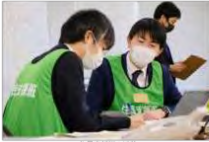
住民支援班の活動