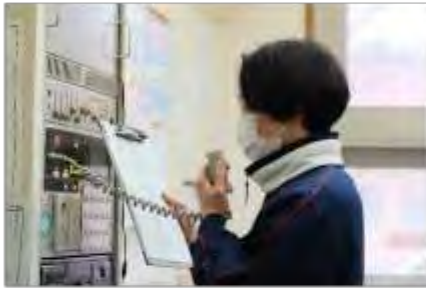
屋内退避実施の連絡