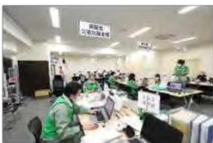
宮城県現地災害対策本部の活動