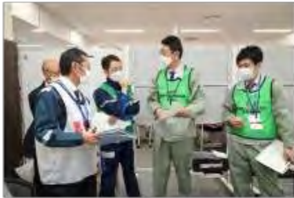
住民安全班、医療班、宮城県現地災害対策本部の調整