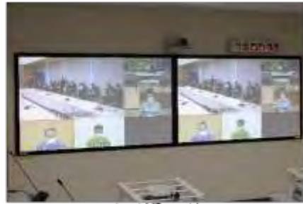
テレビ会議システム