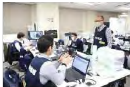
実動対応班の活動