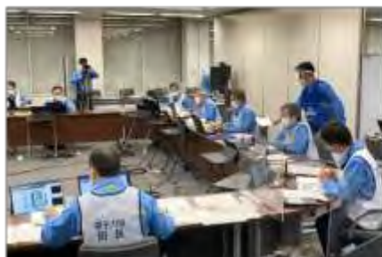
本店対策本部の活動