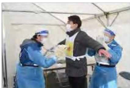
住民の検査(発熱者対応)