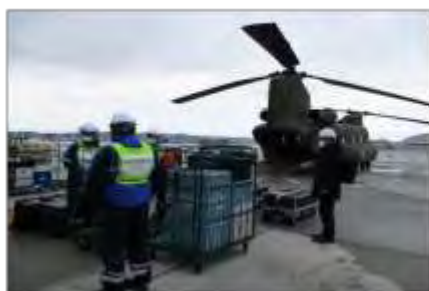
原子力事業者支援連携訓練