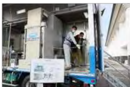
移動式体表測定車による測定