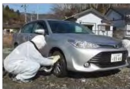
車両スクリーニング・除染