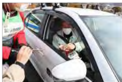
安定ヨウ素剤の配布