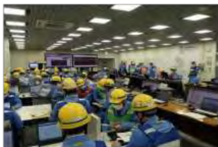
発電所対策本部の活動