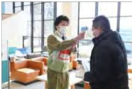
検温(高清水体育センター)