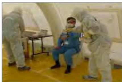
人のスクリーニング