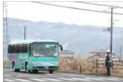
宮城県警による交通規制