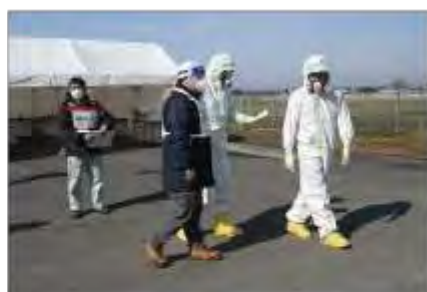
除染必要者の引渡し