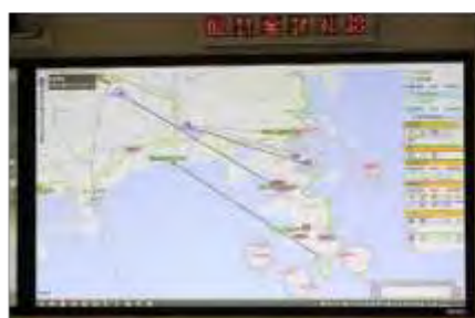
避難車両等の情報