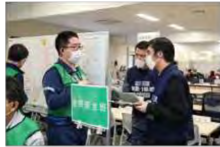
住民安全班と実動対応班の調整