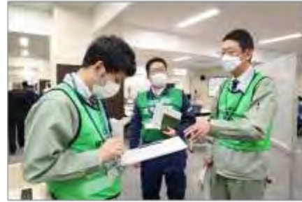
宮城県現地災害対策本部と住民安全班の調整