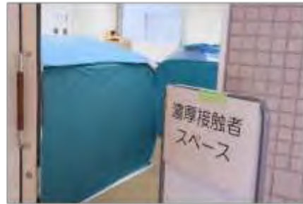
濃厚接触者専用避難スペース(古川保健福祉プラザ)