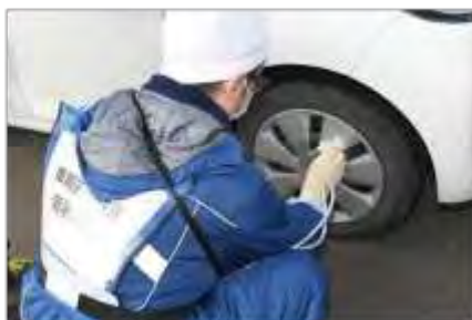
拭き取りによる簡易除染