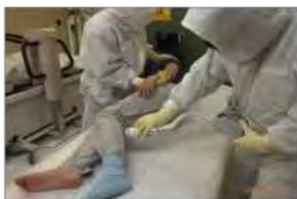
原子力災害医療訓練