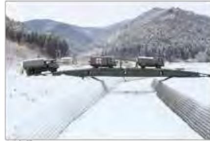
陸上自衛隊による架橋