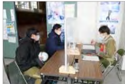
アクリル板を設置した受付(高清水体育センター)