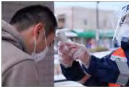
検温(古川保健福祉プラザ)