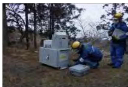
緊急時モニタリング実施訓練