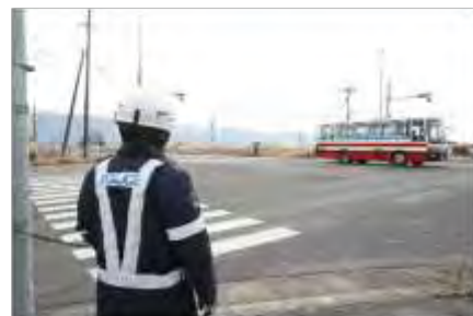
宮城県警による交通規制