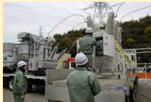
発電所構内に移動用変電設備を設置する訓練