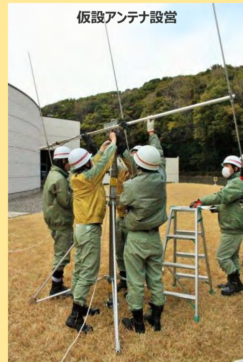
浜岡原子力館での前進基地の設営・運営訓練