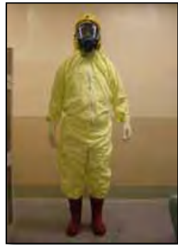
タイベックスーツ