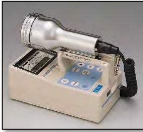
サーベイメータ(GM管)