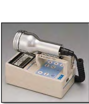
サーベイメータ(GM管)