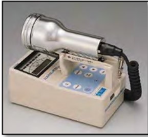
サーベイメータ(GM管)