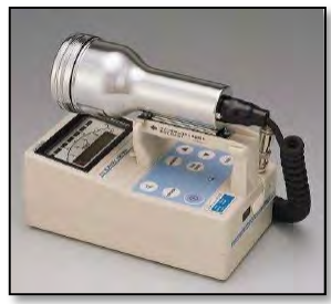
サーベイメータ(GM管)