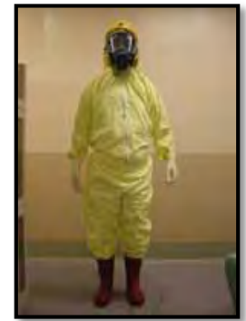
タイベックスーツ