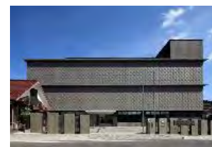
愛媛県オフサイトセンター