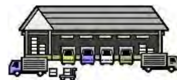
安定ヨウ素剤集積所