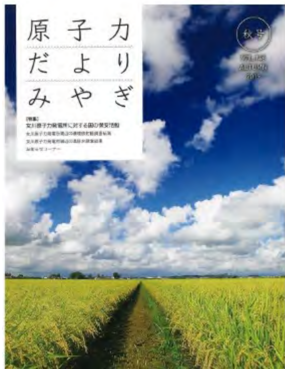
【原子力だよりみやぎ】

ホームページ上で閲覧可能 http://www.pref.miyagi.jp/soshiki/gentai/tebiki.html