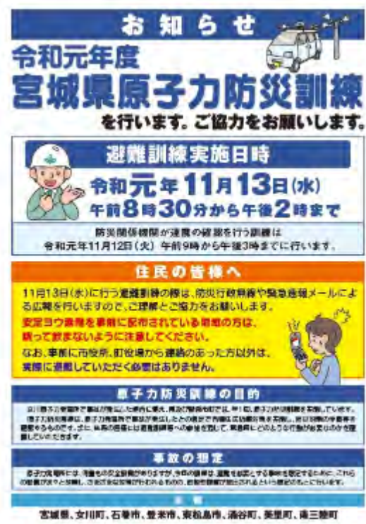
【原子力防災訓練リーフレット】

ホームページ上で閲覧可能 http://www.pref.miyagi.jp/soshiki/gentai/o-gensiryokudayori.html