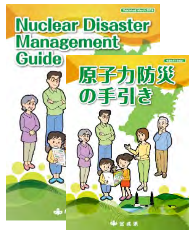
【原子力防災の手引(日本語版・英語版)】

ホームページ上で閲覧可能 http://www.pref.miyagi.jp/soshiki/gentai/tebiki.html