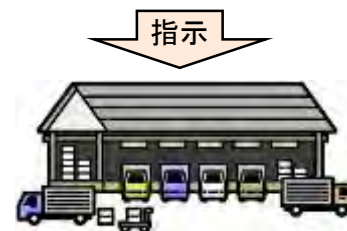
安定ヨウ素剤集積所