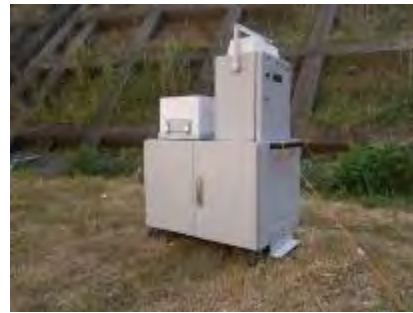
可搬型モニタリングポスト (衛星回線による通信機能付)