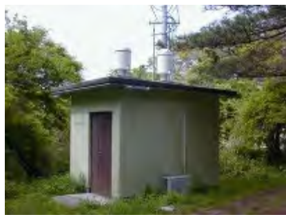
モニタリングポスト