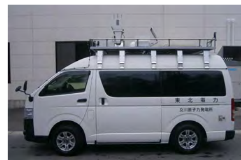
モニタリングカー