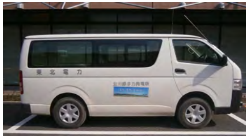
サーベイメータ等を搭載した車両