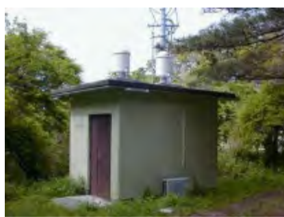
モニタリングポスト