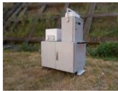
可搬型モニタリングポスト (衛星回線による通信機能付)