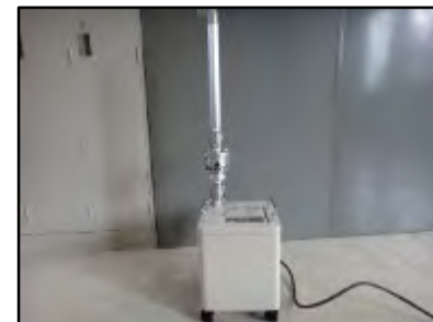
ダストヨウ素サンプラ