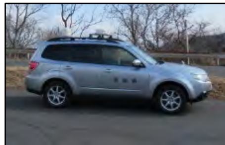
モニタリングカー