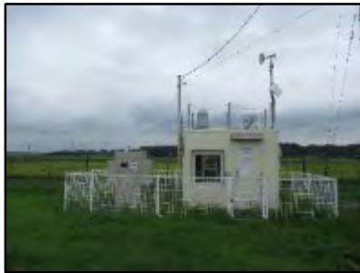
モニタリングステーション (非常用発電機装備)