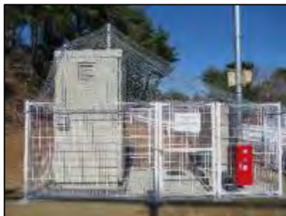
大気モニタ、オートサンプルチェンジャー 付きヨウ素サンプラ