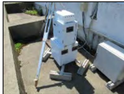
可搬型モニタリングポスト