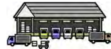
安定ヨウ素剤集積所