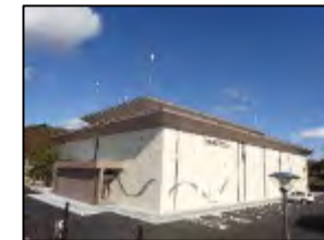
おながわ 宮城県女川オフサイトセンター