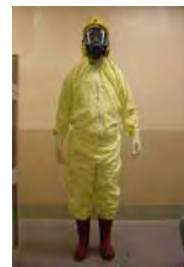
サーベイメータ(GM管) 個人線量計 タイベックスーツ