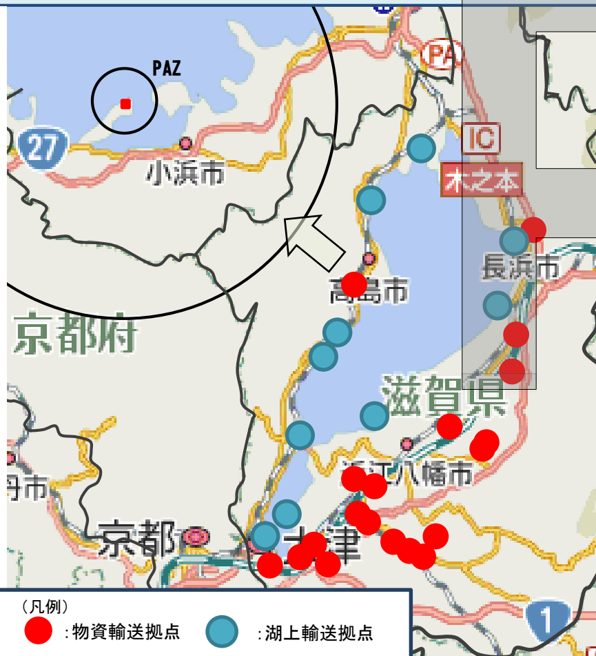
(凡例) ● : 物資輸送拠点 ● : 湖上輸送拠点