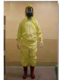
サーベイメータ(GM管) 個人線量計 タイベックスーツ