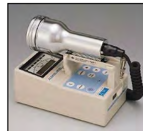
サーベイメータ(GM管)