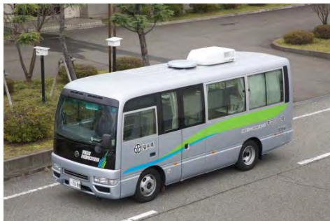
ガンマ線核種分析ラボ車 (高性能モニタリングカー)