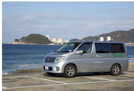
モニタリングカー