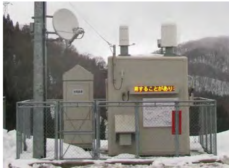
モニタリングポスト (非常用発電機装備)