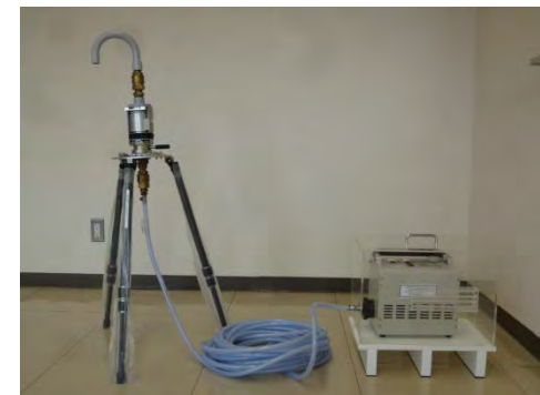
資機材例 (可搬型ダストヨウ素サンプラー)