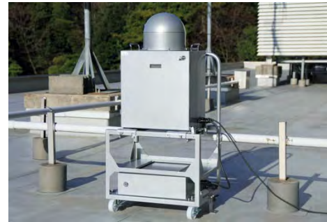
可搬型モニタリングポスト