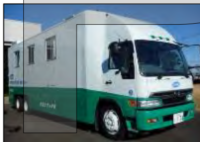
移動式全身測定車