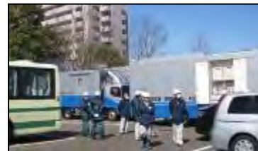
緊急被ばく医療のための受入体制構築