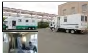
作業員の内部被ばく測定

※平成23年東日本大震災時における 国立研究開発法人日本原子力研究開 発機構の活動