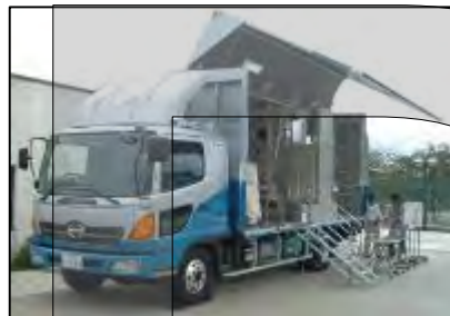
移動式体表面測定車