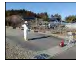
緊急時モニタリング