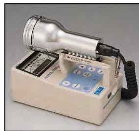
サーベイメータ(GM管)