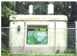
モニタリングポスト等【6台】