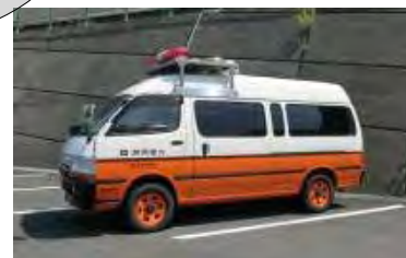
モニタリングカー【2台*】