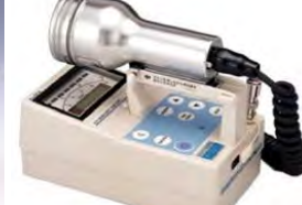
(サーベイメータ類)