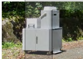
可搬型モニタリングポスト【10台】