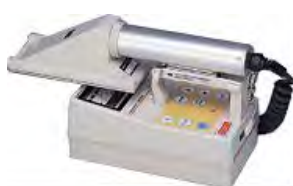
ZnSシンチレーション サーベイメータ