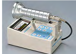
β線サーベイメータ