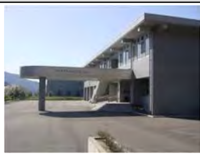
福井県大飯オフサイトセンター (おおい町)

・加えて、福井県は、福井県石油業協同組合と協定を締結しており、オフサイトセンターなど災害対策上重要な公的施設等に優先給油される仕組みを構築し、給油確保方策も確立。