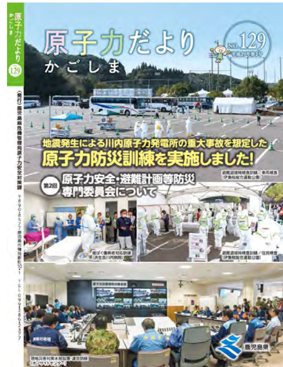
原子力だよりかごしま を年に3回程度発行