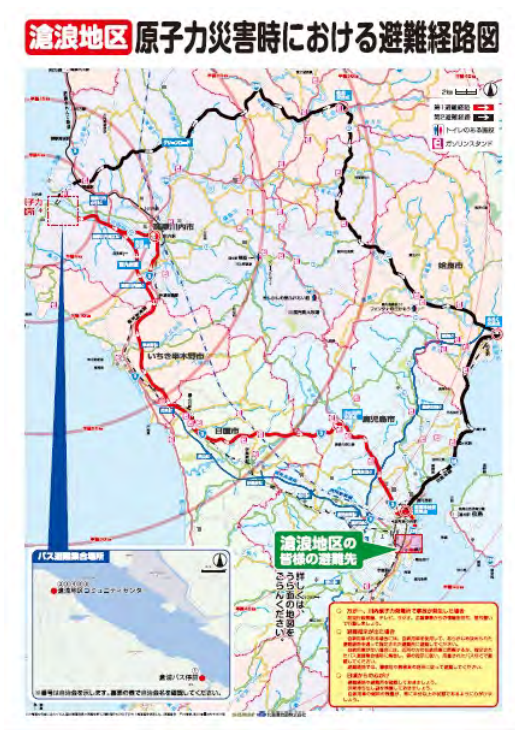
薩摩川内市が全戸配布している 避難経路図