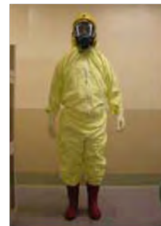
タイベックスーツ