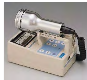
サーベイメータ(GM管)