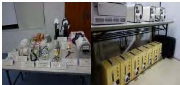
放射線防護資機材