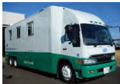
移動式全身測定車