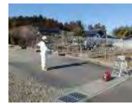
緊急時モニタリング