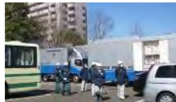
緊急被ばく医療のための受入体制構築