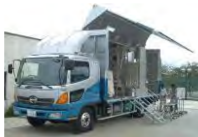
移動式体表面測定車