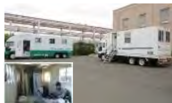
作業員の内部被ばく測定