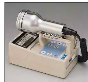
サーベイメータ(GM管)