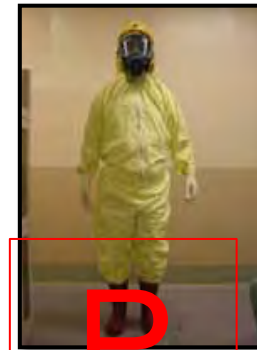
タイベックスーツ