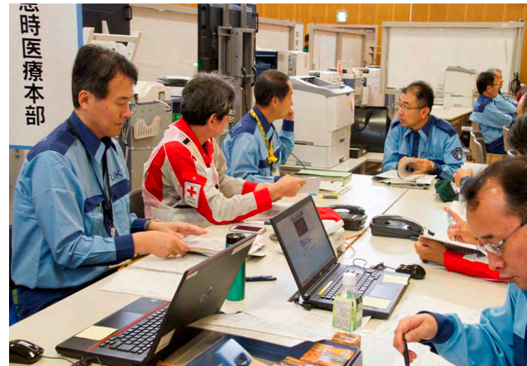
各機能班における情報共有