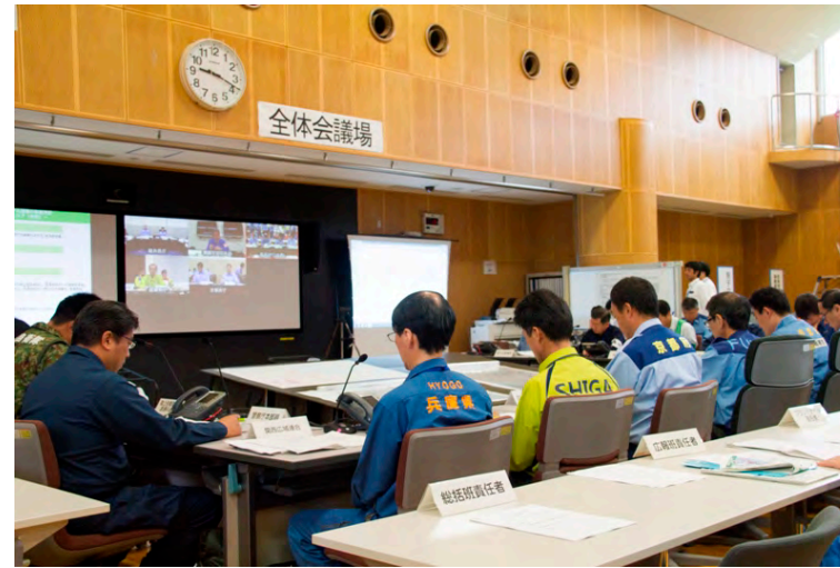
合同対策協議会 全体会議 (TV会議を活用)