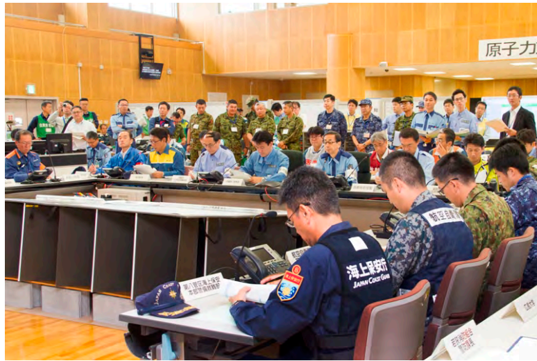
合同対策協議会 全体会議の様子