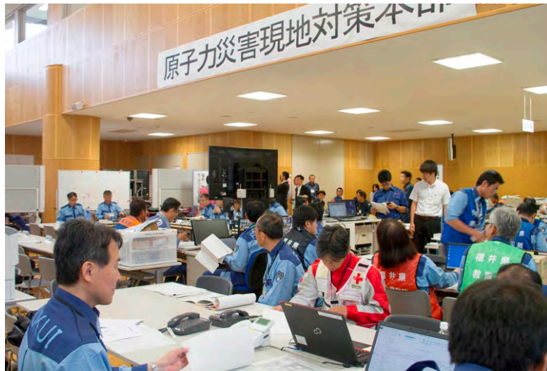
福井県原子力災害現地対策本部