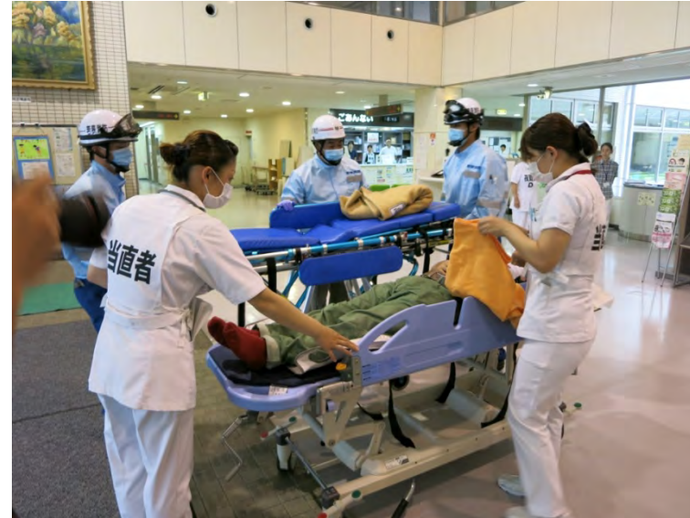
高浜病院入所者の搬送