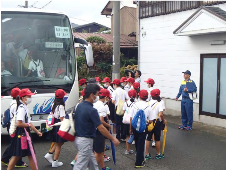
高浜小学校児童のバス避難