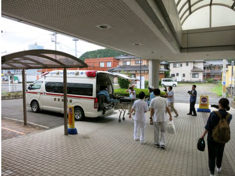
高浜町 在宅要支援者(重篤患者)の高浜病院への搬送