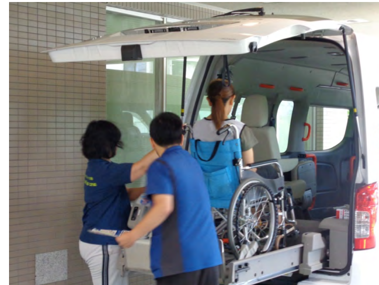
社会福祉施設リバーサイド`気比`の杜での要支援者受入