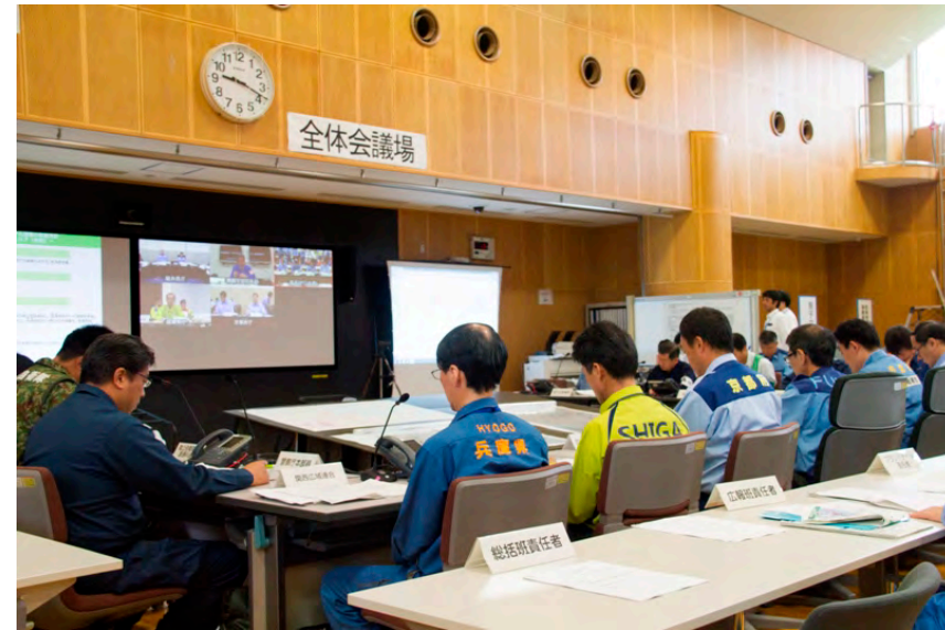
合同対策協議会 全体会議 (TV会議を活用)