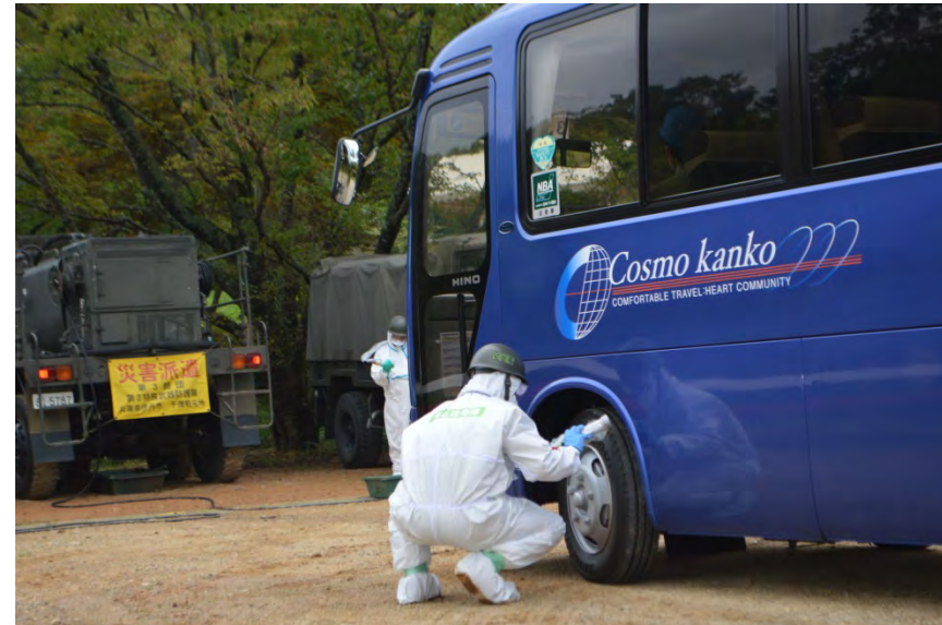
避難バス車両のスクリーニング(丹波自然運動公園)