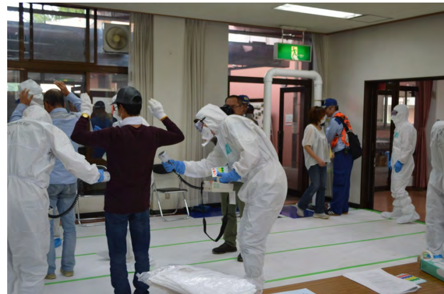
スクリーニング(丹波自然運動公園)