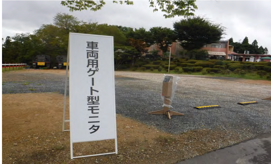
車両用ゲートモニタ(丹波自然運動公園)