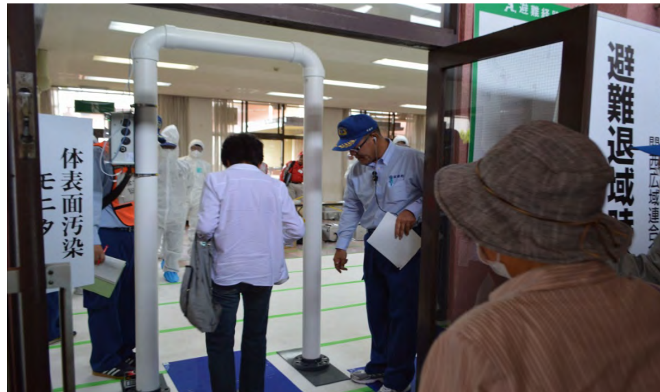
体表面汚染モニタ(丹波自然運動公園)