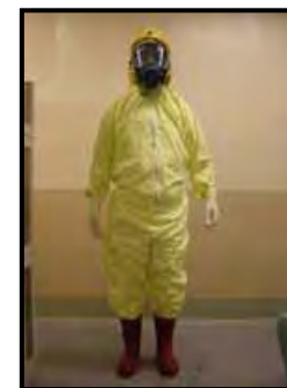
タイベックスーツ

※本協定のほか、関西電力、北陸電力、中国電力、四国電力および九州電力の5社間において「原子力事業における相互協力に関する協定」を締結(平成28年8月5日)