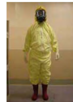
タイベックスーツ