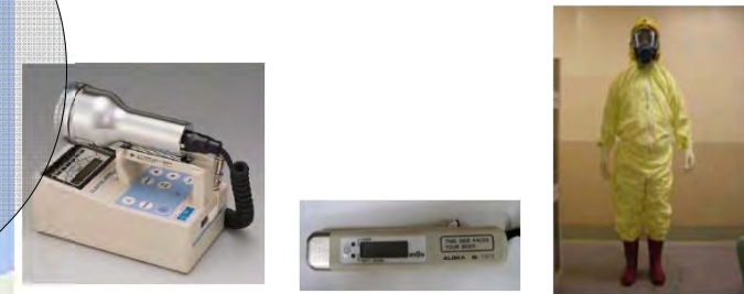
サーベイメータ(GM管) 個人線量計 タイベックスーツ