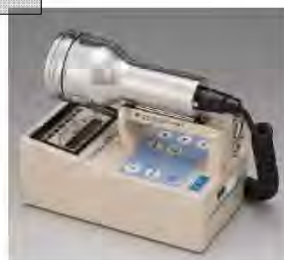
サーベイメータ(GM管)