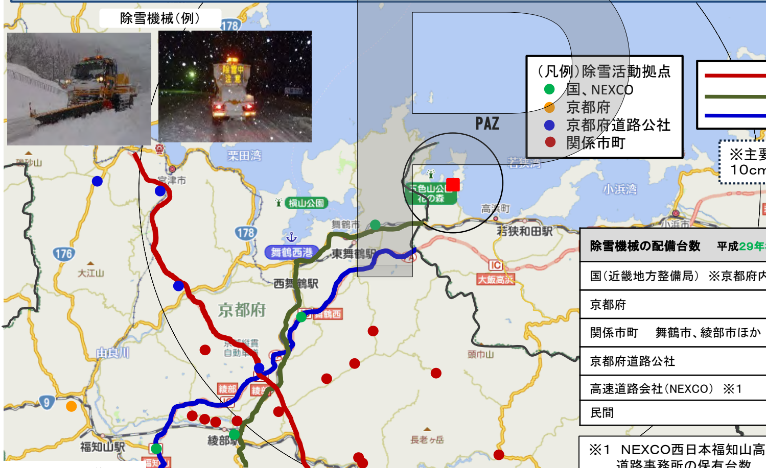
除雪機械の配備台数 平成29年3月時点