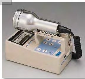
サーベイメータ(GM管)