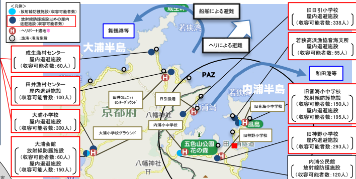
<(PAZの例) 半島地域が孤立した場合の対応(内浦半島、大浦半島)>