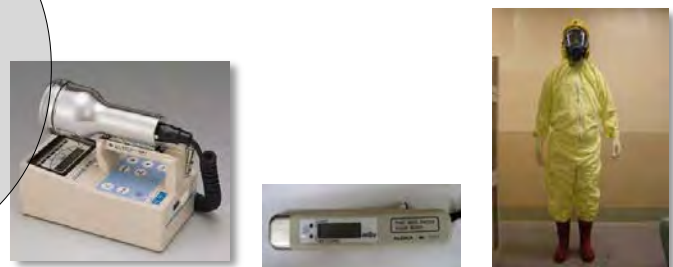
サーベイメータ(GM管) 個人線量計 タイベックスーツ