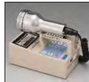
サーベイメータ(GM管)