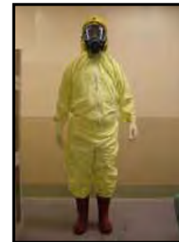
タイベックスーツ