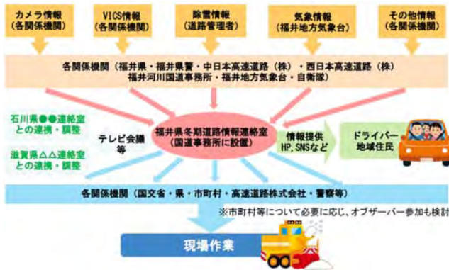
<福井県における情報連絡本部(例)>