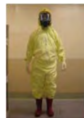
タイベックスーツ

※本協定のほか、関西電力、北陸電力、中国電力、四国電力及び九州電力の5社間において「原子力事業における相互協力に関する協定」を締結(平成28年8月5日)