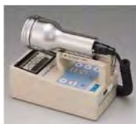
サーベイメータ(GM管)