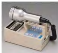
サーベイメータ(GM管)