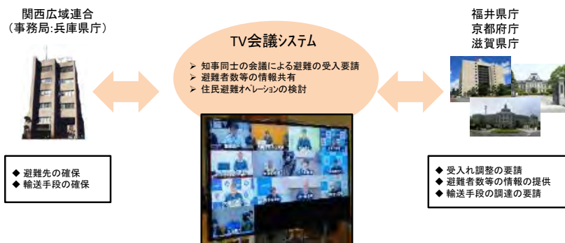
<情報共有のイメージ>