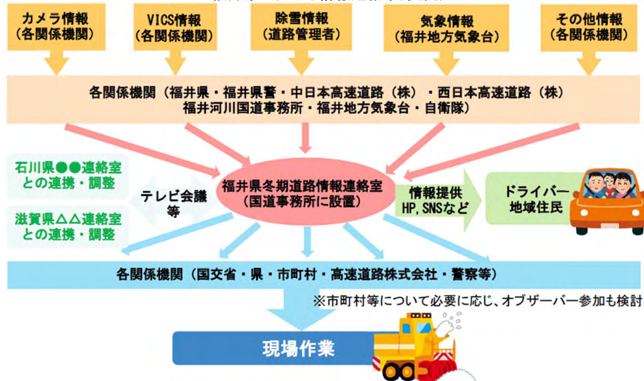
＜福井県における情報連絡本部(例)＞