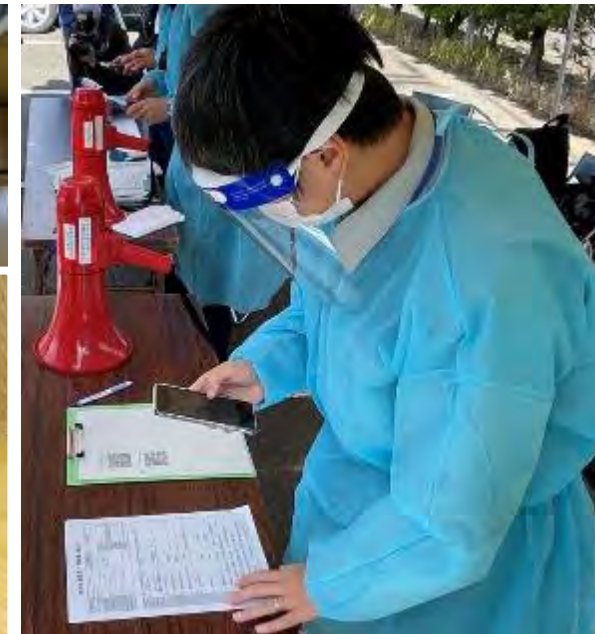
外国人避難者受入に翻訳アプリを利用して対応(芦原温泉 美松)