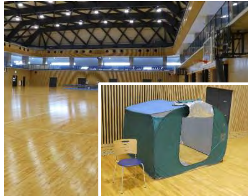
避難所(高浜中央体育館)内、パーティションを準備