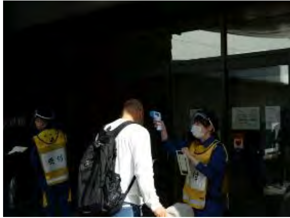
受付での検温(高浜中央体育館)