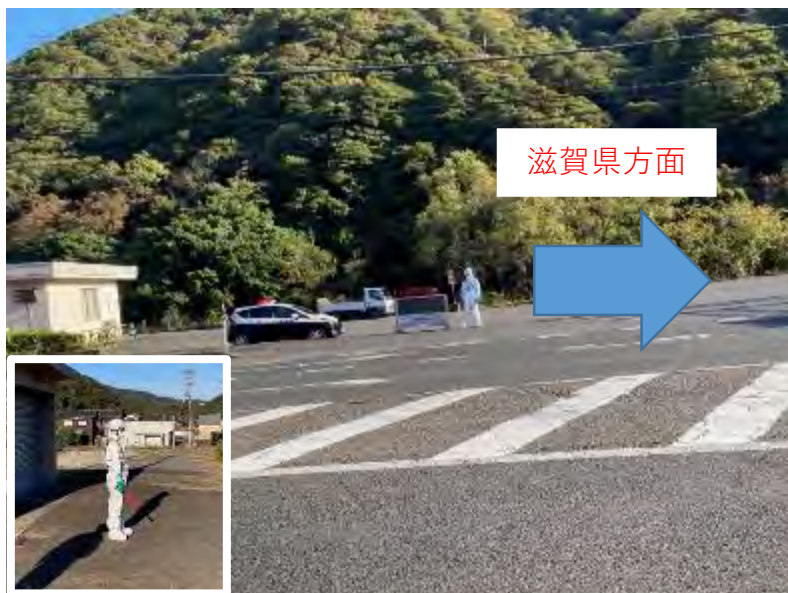
警察官立哨(規制なし)