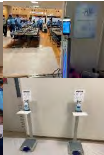
入口に消毒液、 体温計を設置