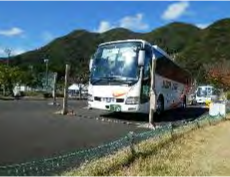
ゲートモニタ (バス)