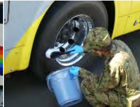
タイヤの除染 (バス)