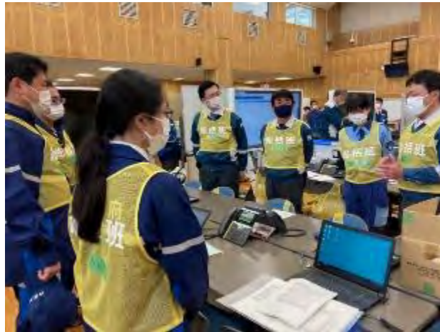
総括班（国要員参加）