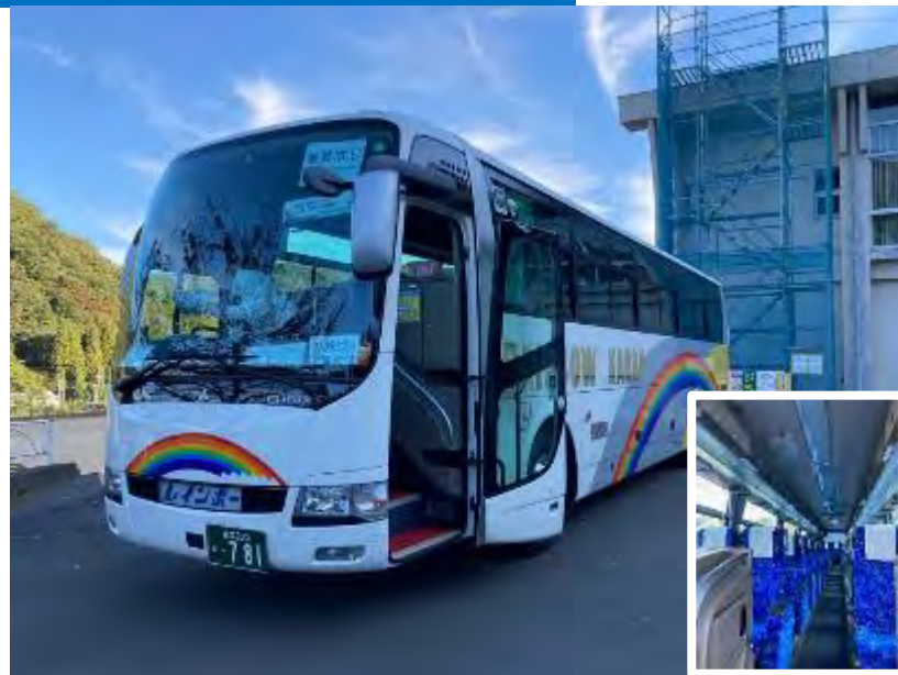
避難用バス(バス車内)