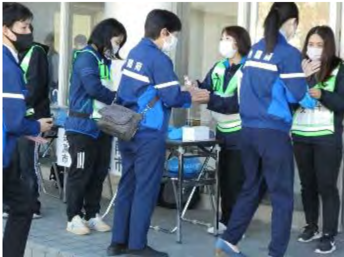
受付での手指消毒