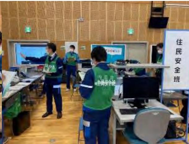
住民安全班（国要員参加）