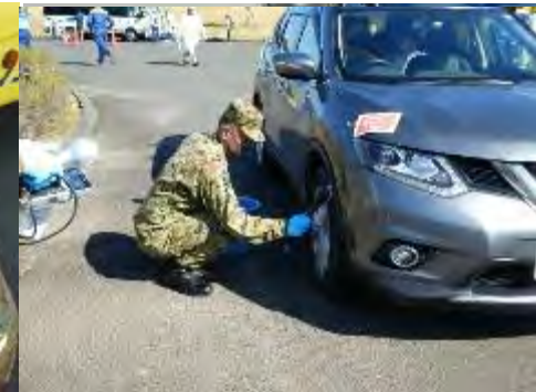
タイヤの除染 (自家用車)