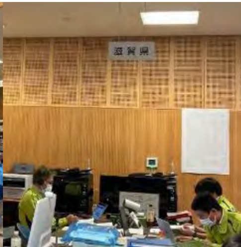
美浜オフサイトセンター内滋賀県及び岐阜県ブース