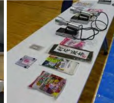
避難訓練参加者に放射線測定体験(高浜中央体育館)