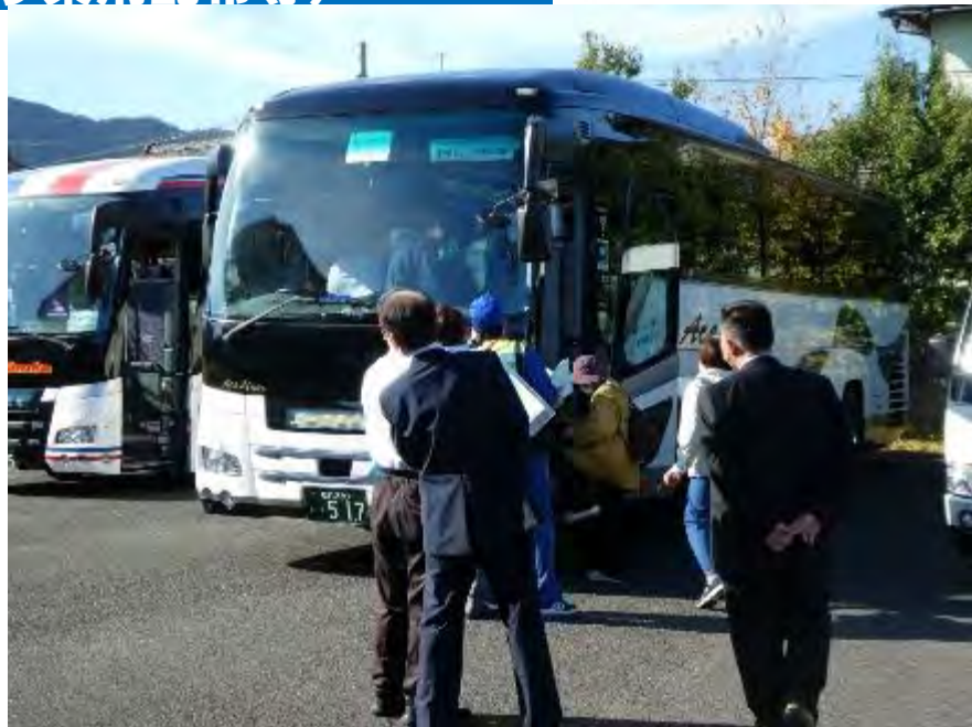
美浜町の住民が一時集合場所（美浜中央小学校）で安定ヨウ素剤を受け取った後バスで避難。