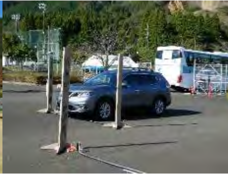
ゲートモニタ (自家用車)