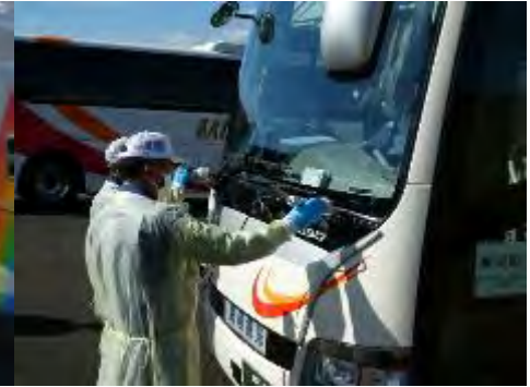
ワイパー付近の測定