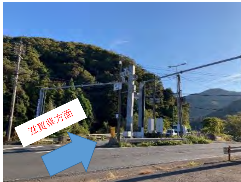
足田交差点(矢印の方向が滋賀県。緊急時は交通規制)