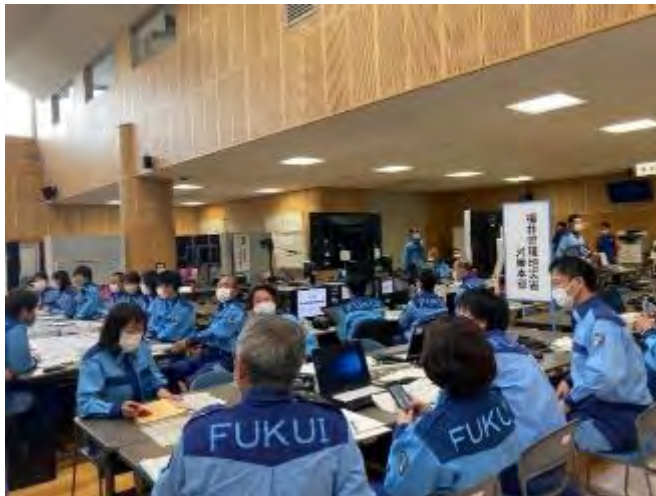
福井県現地災害対策本部