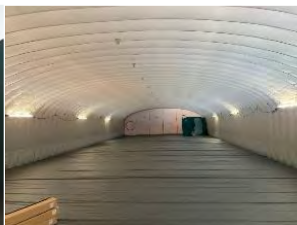
屋内退避時の放射線防護対策のための「エアシェルター」。 エアシェルター内でスペースを仕切るためのパーティションを設営。