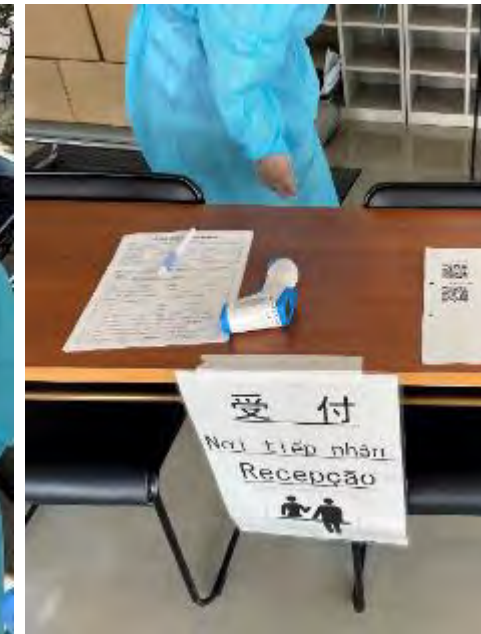
避難所(トリムパークかなづ)に外国人対応用受付を設置