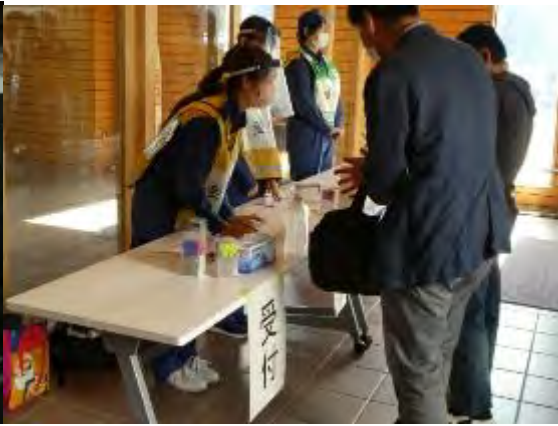
受付での手指消毒(高浜中央体育館)