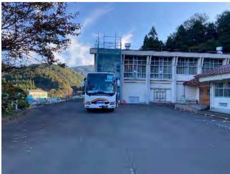
愛発公民館(一時集合場所)