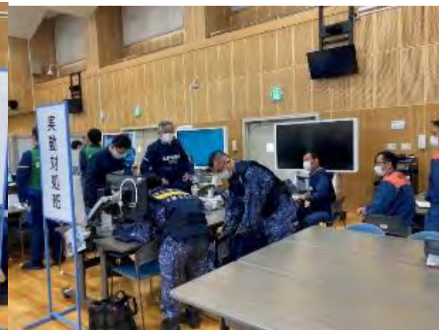
実動対処班（国要員参加）