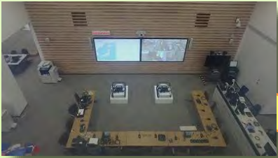
プレスセンターから全体会議室を見ることができます。