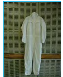
タイベックスーツ