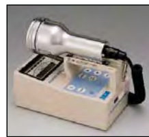
サーベイメータ(GM管)