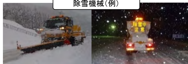
<除雪機械の保有台数>