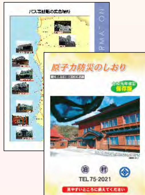
原子力防災のしおり (バス集合場所の地図等を記載)