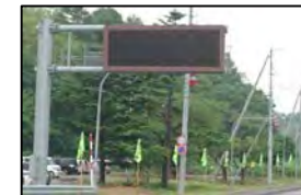
避難経路等に99箇所設置