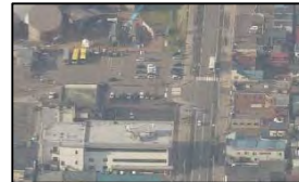
道路渋滞状況を把握し、避難誘導・交通規制