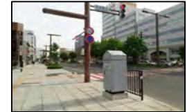
避難経路に21箇所設置