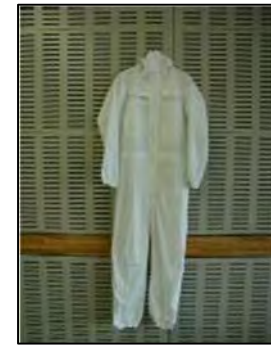
タイベックスーツ