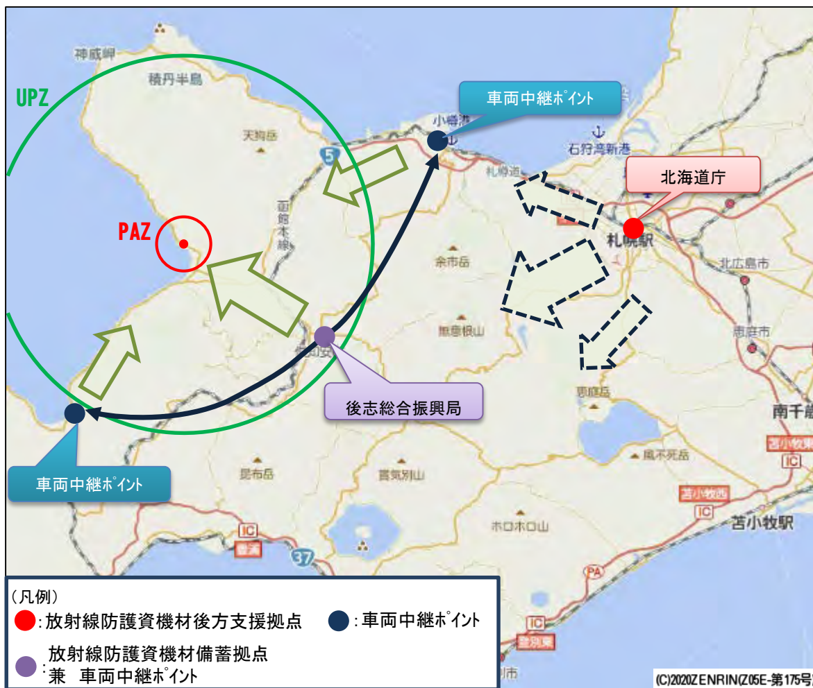
＜バス事業者等に対する放射線防護資機材の配布体制＞