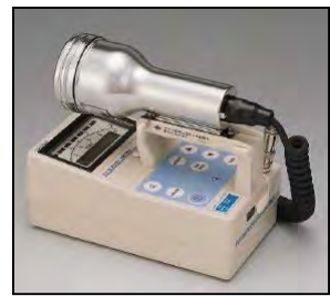
サーベイメータ(GM管)