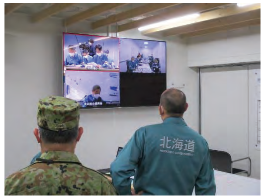
＜道災害対策本部（指揮室での共有）＞