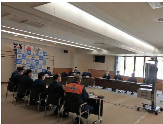
＜災害対策本部員会議（泊村）＞