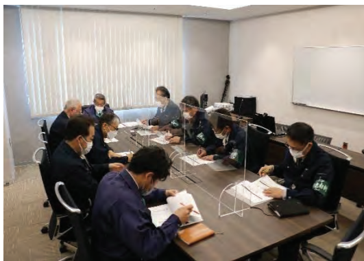
＜災害対策本部員会議（神恵内村）＞