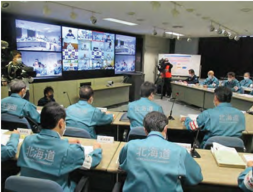
＜道災害対策本部員会議（OFC等とTV会議）＞