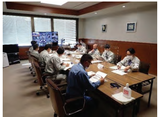
＜災害対策本部員会議（共和町）＞