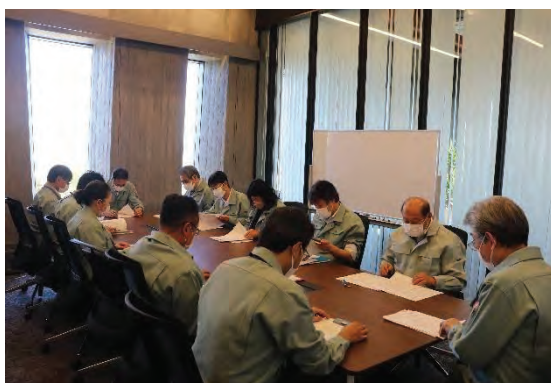
＜災害対策本部員会議（古平町）＞